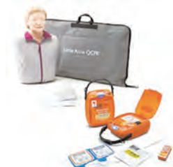
心肺蘇生人形トレーニングセット 1セット