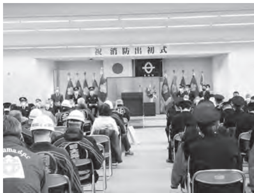
草津市消防出初式

新春を飾る消防出初式が去る1月9日（日）に管内一斉に挙行されました。協会役員が式典会場に列席し、参加者の皆さまと、この一年間の防火防災意識の高揚と安全で住みよい街づくりを祈念されました。