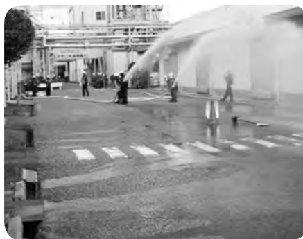
総合防災訓練放水