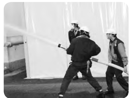
交替職場防火訓練放水