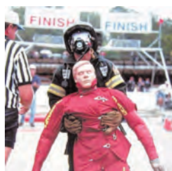
救助訓練用的人形 1体