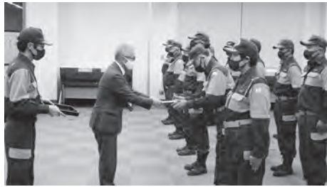
栗東市消防団の出動式

なお、草津市消防団は、新型コロナウイルス感染症の感染拡大の防止を図るため出席者を抑制して実施されたことから協会役員は出席しておりません。なお、各消防分団による市内巡回広報活動は12月30日まで実施されました。