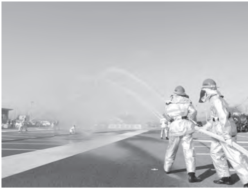
守山市消防出初式