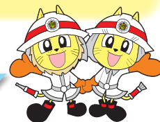
ライくん レイちゃん (湖南広域消防局キャラクター)

この季節は、空気が乾燥して火災が発生しやすくなっています。 本運動を機会に、今一度、防火の重要性を再認識いただき、火災による死傷者の発生や財産の損失を防ぐため、身近な出火防止対策への取り組みにご協力をお願いいたします。