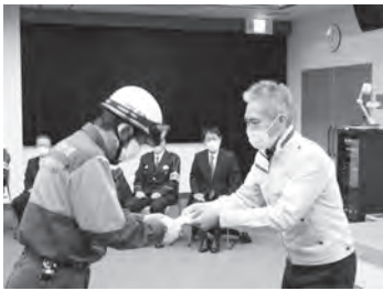
野洲市消防団の出動式