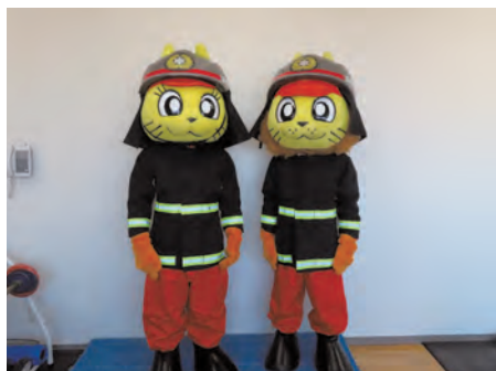
着ぐるみ防火衣・ヘルメット 2セット