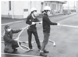
消火訓練（屋内消火栓）