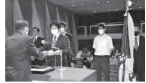
会長優良事業所表彰

馬場商事株式会社 滋賀県輸送事業協同組合 タカラバイオ株式会社 湖南運輸株式会社 ヤンマーアグリジャパン株式会社 中部近畿支社 ふくだ医院 イオンビック株式会社 ザ・ビッグエクストラ野洲店 鴻池運輸株式会社滋賀流通センター営業所