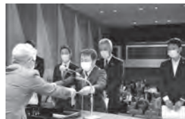
南支部長優良事業所表彰

イオンモール株式会社 イオンモール草津 オッペン化粧品株式会社 滋賀工場 有限会社アサノ石油 草津イトマンフィット ネスクラブ