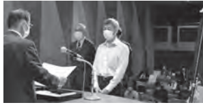
防火標語最優秀表彰