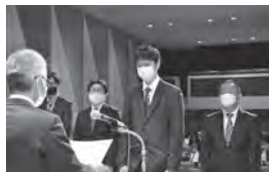
北支部長優良事業所表彰

株式会社シンクス 株式会社岩崎硝子 守山センター 株式会社田中水道 守山環整株式会社 滋賀ダイハツ販売株式会社 物流センター