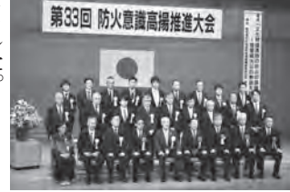
知事・県連合会長表彰の受賞写真

大会では、永年に亘り危険物の安全管理、災害の防止等を積極的に推進された事業所や個人に対して、滋賀県副知事及び滋賀県防火保安協会連合会長から表彰状が授与されました。 当協会から次の事業所・個人の方々が受賞の栄に輝かれました。