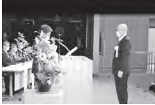
知事・県連合会長表彰の受賞写真