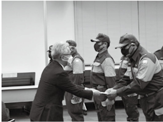
栗東市消防団（12月27日栗東市危機管理センター）

管内の消防団が、年末の火の用心を市民の皆様に訴えるため年末の夜警出動式が実施されました。各消防団の激励に南支部・北支部の役員が出席し、消防団員の皆さんに激励を行いました。