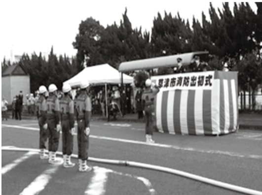
草津市消防団（草津市役所）

新春を飾る消防出初式は、1月8日（日）草津市・守山市・栗東市で、1月15日（日）に野洲市で挙行されました。各支部の役員が式典会場に列席し、一年間の防火防災意識の高揚と安全で住みよい街づくりを祈念されました。