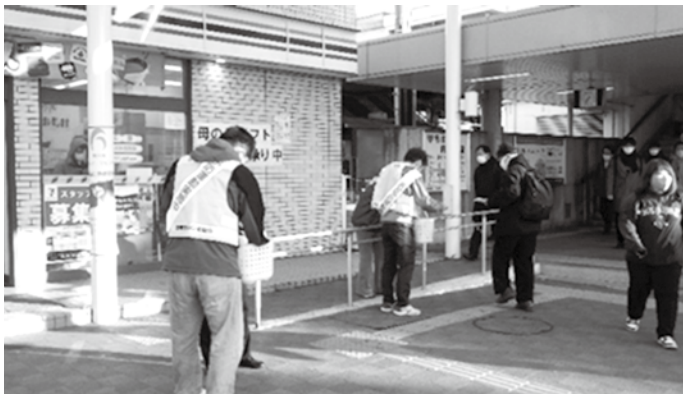
野洲駅での街頭広報

春の火災予防運動が3月1日から7日まで展開されるにあたり、3月1日の午前7時30分から8時まで草津・南草津・栗東・手原・守山・野洲の各駅にて街頭広報を実施し、防火啓発物品を配布しながら火の用心を訴えました。