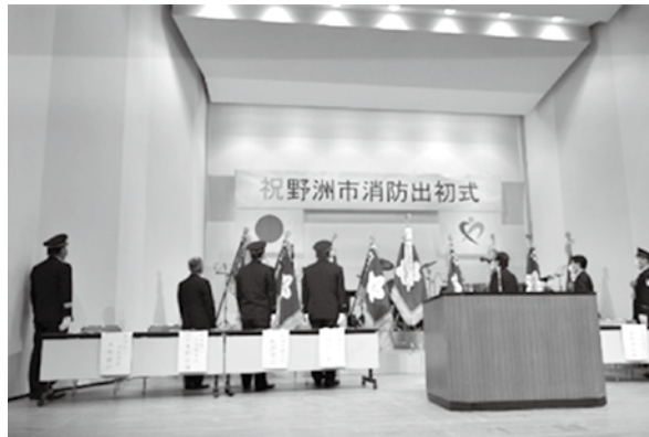
野洲市消防団（さざなみホール）