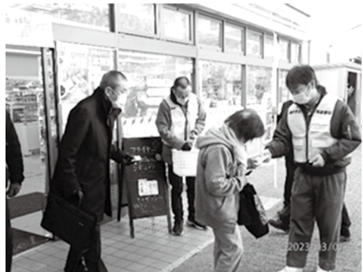
守山駅での街頭広報