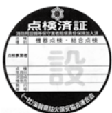
消火器以外の 消防用設備等用

点検実施者の責任の明確化、点検の確実な履行の促進等を目的とした点検済表示(ラベル)制度は、全国統一的に推進しています。