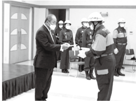
守山市消防団（12月24日北消防署多目的研修室）