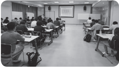
守山市防災センターにて開催