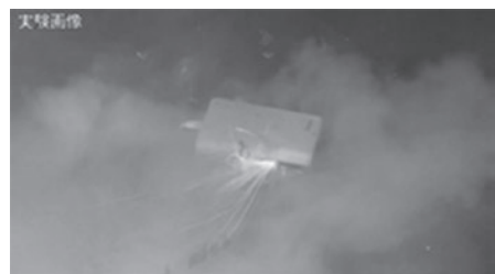
リチウムイオン電池から発火する様子