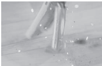
落下により火花が散っている写真

落下などにより大きな衝撃が加わると、変形や電池内部の損傷により、発火することがあります。