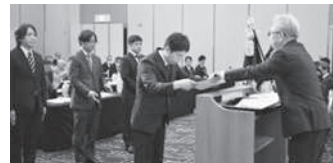
南支部長表彰従業員