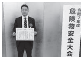
全危連表彰 三恵工業(株)

永年に亘り危険物施設の事故防止及び安全思想の普及等に努められた功績により受賞されました。受賞まことにおめでとございます。