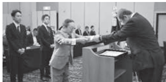
北支部長表彰事業所