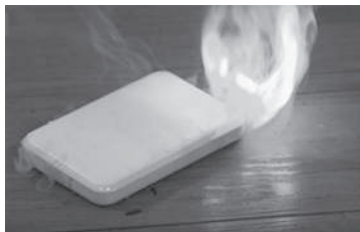
水没したバッテリーが突然発火した写真

作業中などで水に水没させた場合、内側に水がしみ込み、異常が生じ、通電時などに内部でショートして発火する場合があります。