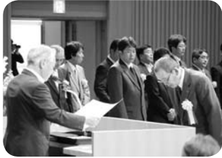
会長表彰防火保安功労者