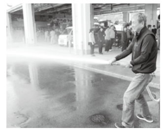
消火訓練（消火器・屋内消火栓）