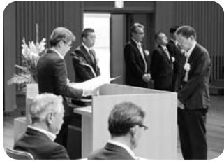
知事表彰優良事業所