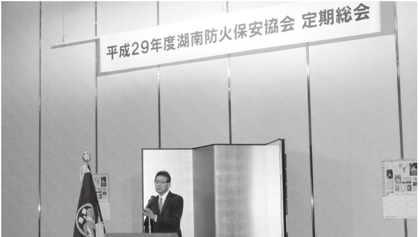
平成29年 5月31日 定期総会（草津エスティアホテル瑞祥の間）