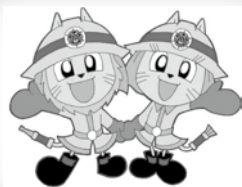
ライくん レイちゃん 《湖南広域消防局キャラクター》