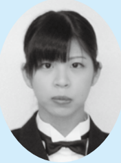
(一財) 守山野洲市民 交流プラザ ライスヴィル都賀山 永元 麻帆

私が今回の研修に参加して、座学や様々な訓練を通して、自然災害への備えや日々の火災に対しての考え方が変わりました。